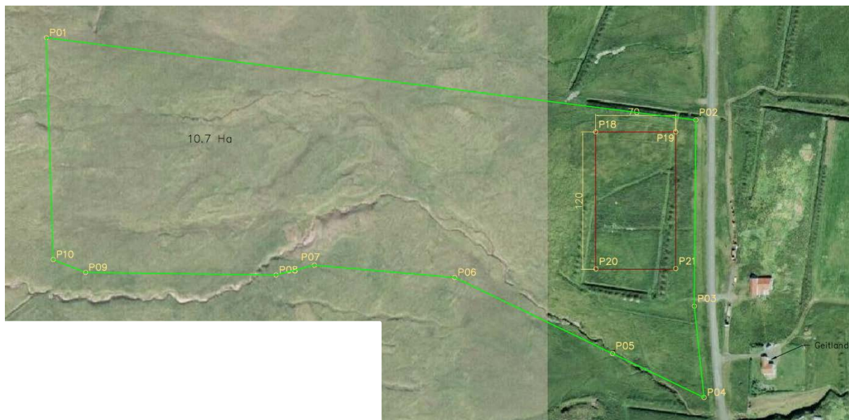
Mynd 1. Yfirlitsmynd af skipulagssvæðinu (VERKÍS, 2016).

Fyrirhugað er að byggja vatnsátöppunarverksmiðju á 11 ha lóð landi Geitlands í Borgarfirði Eystra. Í gildandi aðalskipulagi er svæðið skilgreint sem landbúnaðarsvæði og ofan við svæðið er afmarkað vatnsverndarsvæði sveitarfélagsins. Sjá má afmörkun svæðisins á mynd 1.