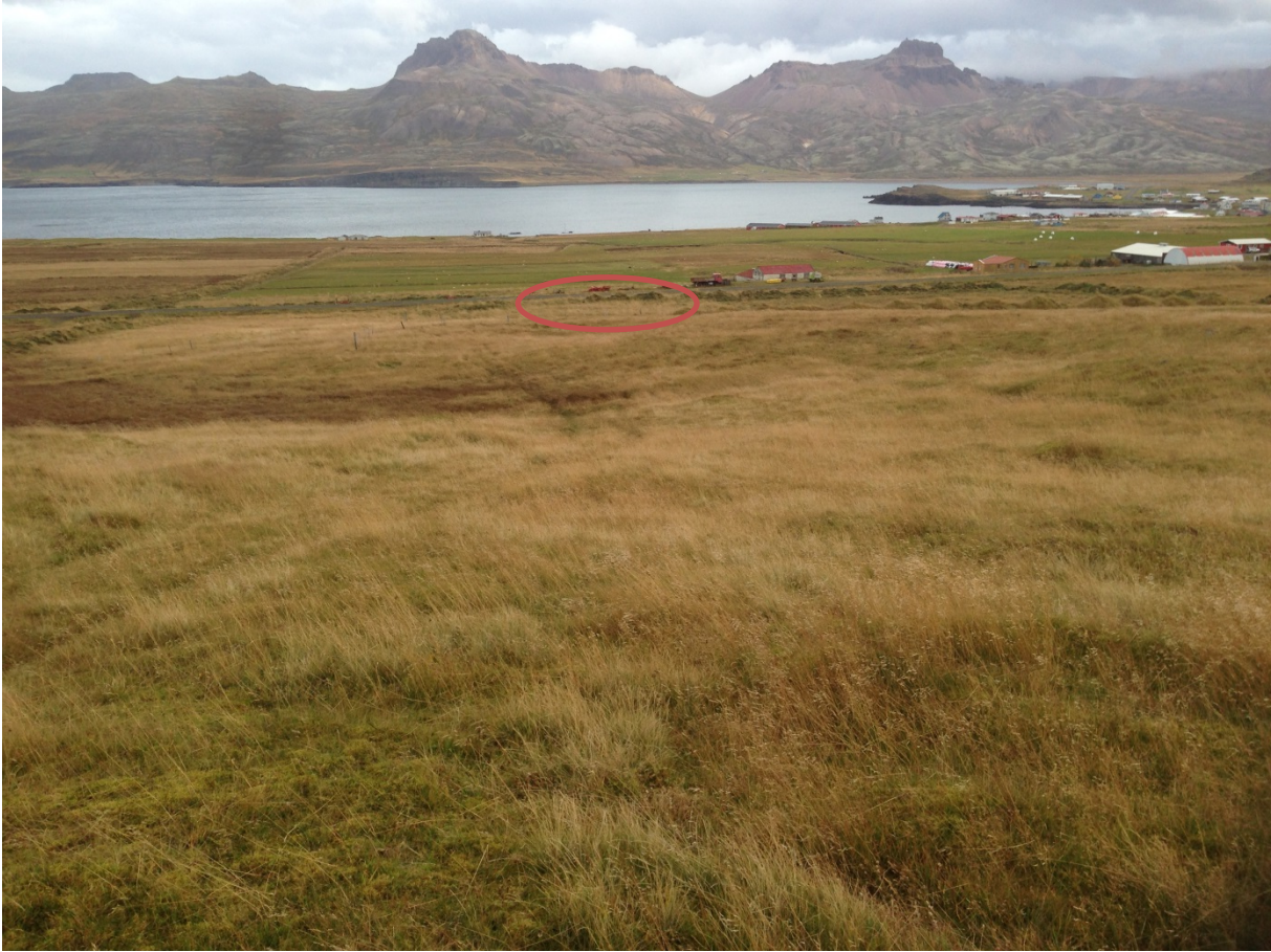
Mynd 4. Tekin til austurs frá miðju landi Geitlands 2, væntanleg staðsetning iðnaðarsvæðis er merkt með rauðu.