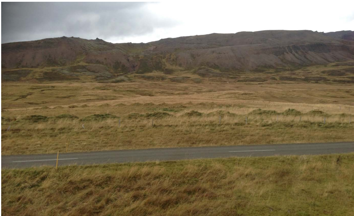
Mynd 3. Er tekin til vesturs upp til fjalls og sýnir Þjóðveg 94 og væntanlegt iðnaðarsvæði sem er beint upp af veginum.

Svæðið sem breytingin tekur til er ofan Þjóðveg 94 og er að hluta til á gömlu túni. Lóðin er þó í nokkrum bratta og nær upp í brekkuna en svæðið er allt neðan 150 m y.s. Á svæðinu eru hvorki friðlýst svæði eða svæði sem njóta sérstakrar verndar skv. 57. gr. laga nr. 60/2013 um náttúrvernd.