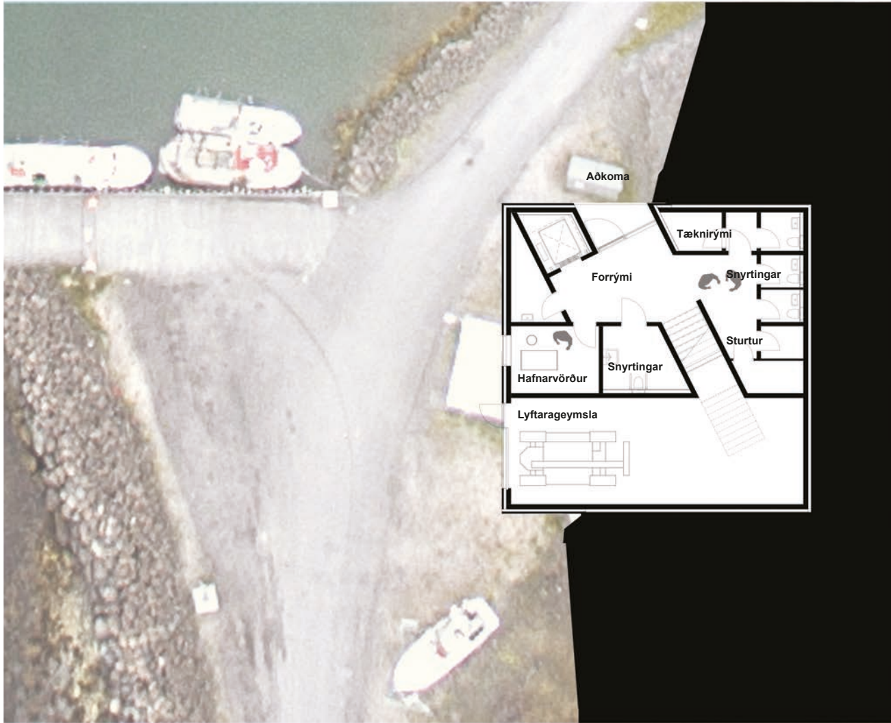
Grunnmynd 1. hæð 1.200