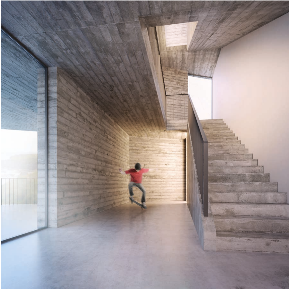
Rýmismynd 2. hæð