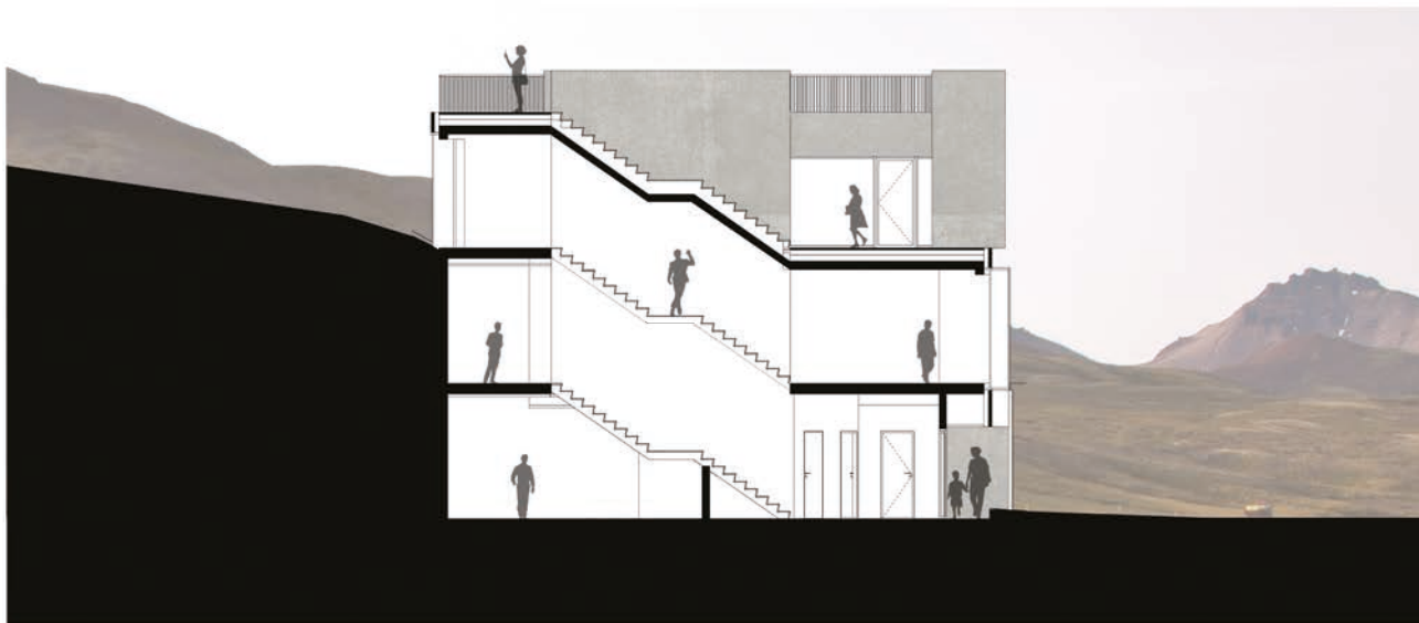
Skurðmynd A-A, 1.200