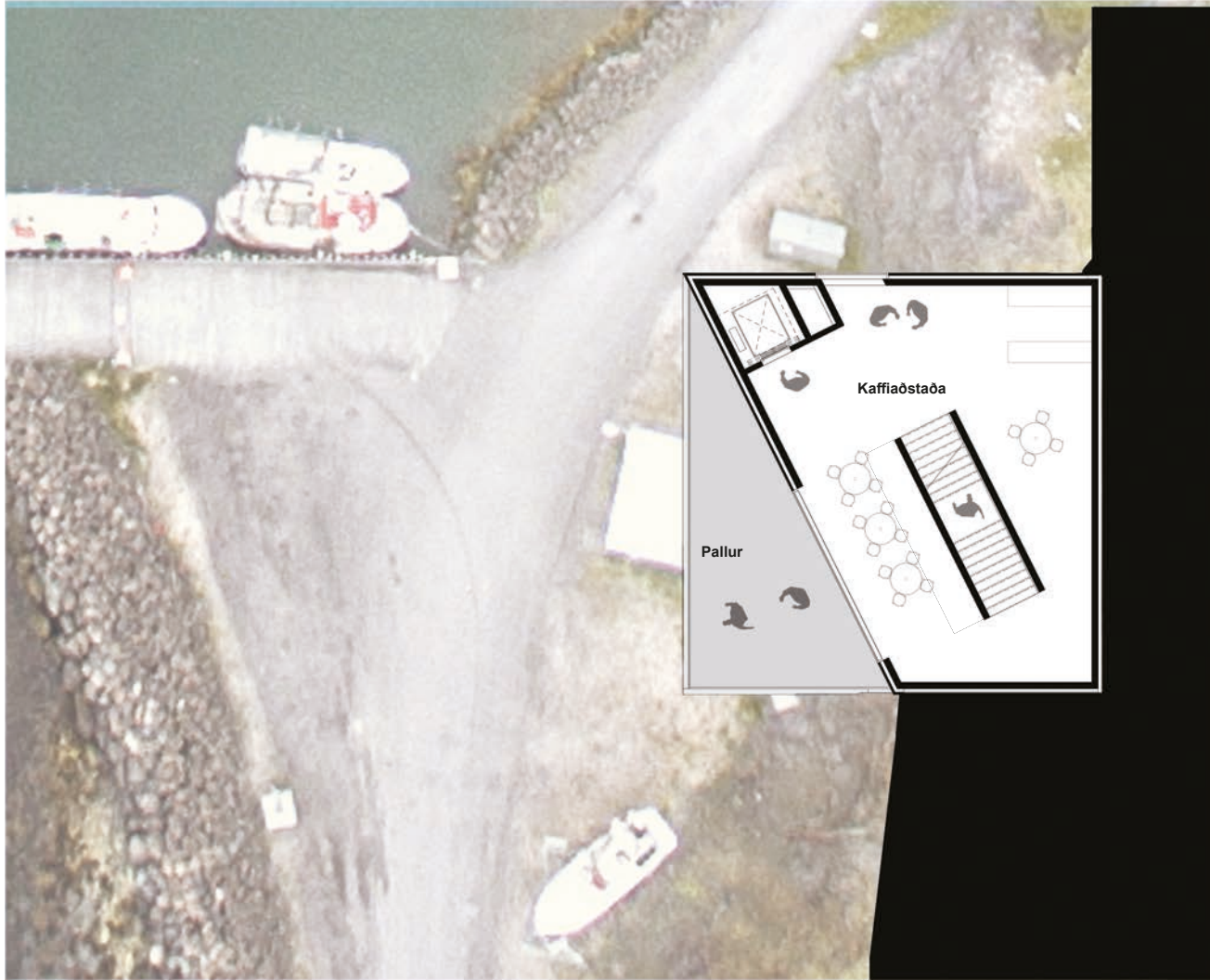
Grunnmynd 2. hæð, 1.200