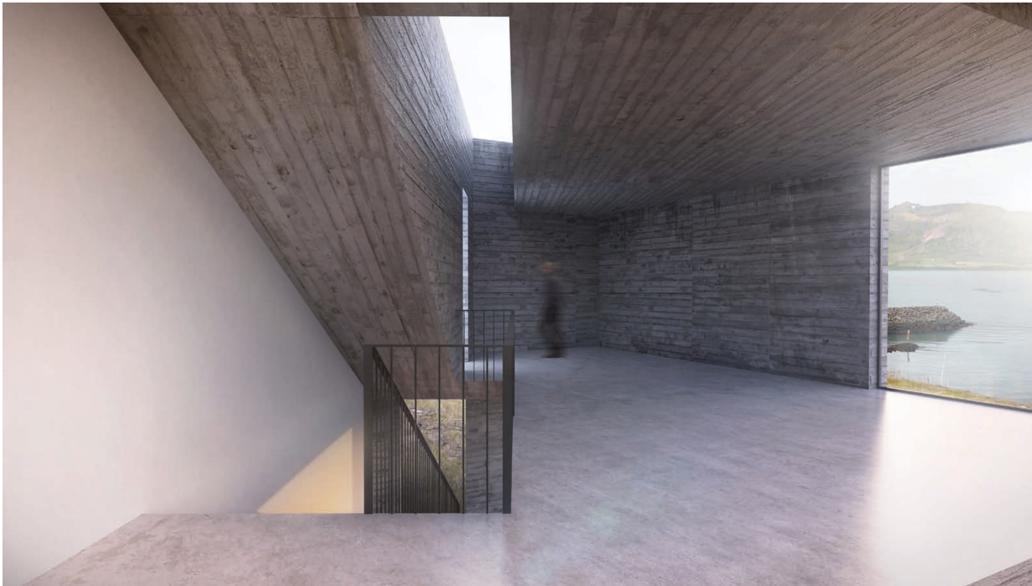
Rýmismynd 3. hæð