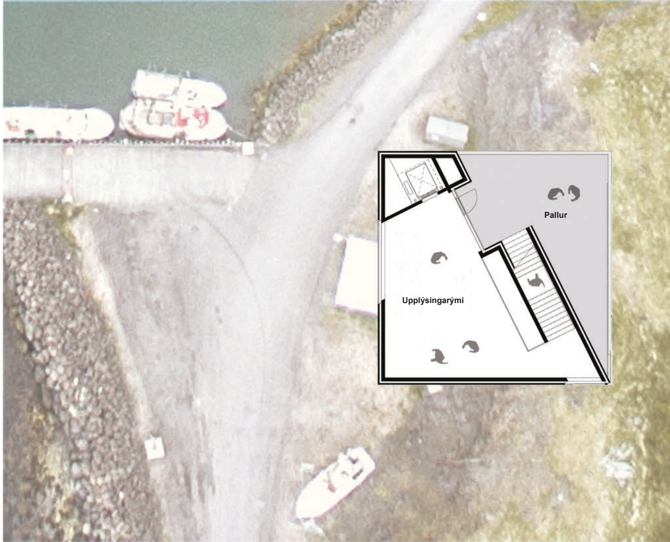
Grunnmynd 3. hæð 1.200