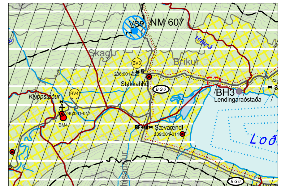
Aðalskipulag Borgarfjarðarhrepps 2004-2016, mkv. 1:50.000.

Sorphyrða. Allt sorp sem fellur til á svæðinu verður flutt á sorpmóttökustaði á Borgarfirði. Þangað verður farið með allt viðeigandi sorp í samræmi við reglur um flokkun þess og mögulega endurvinnslu.