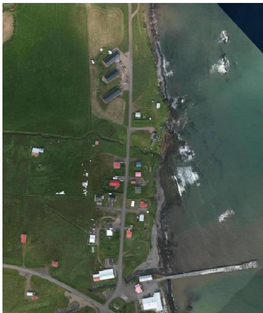
Mynd 2. Loftmynd af svæðinu.

Í Aðalskipulagi Borgarfjarðarhrepps 2004 – 2016 er breytingarsvæðið skilgreint sem almennt landbúnaðarsvæði annars vegar og opin svæði til sérstakra nota hins vegar. Taka þarf um 0,95 ha úr landbúnaðarnotkun. Stærstur hluti þess svæðis er framræst tún en einnig óræktað land.