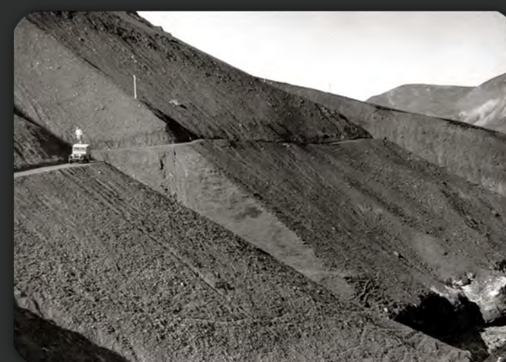
Skömmu eftir að vegurinn var ruddur