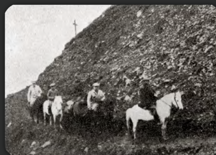
Ari Arnalds sýslumaður á ferð ásamt förunefti árið 1925