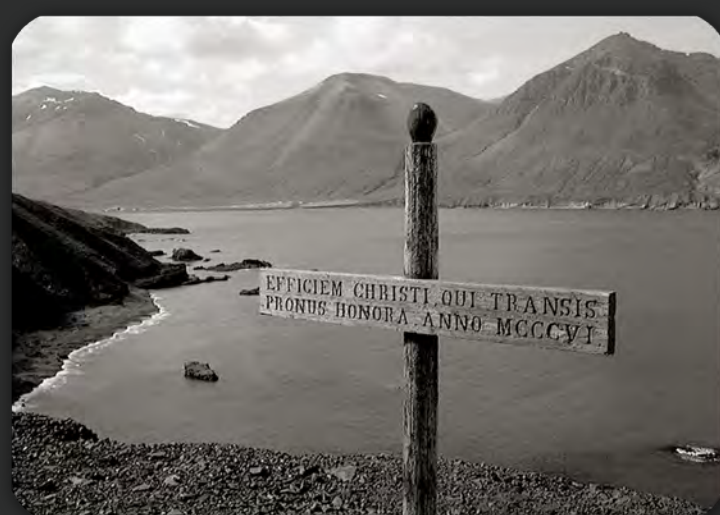
Krossinn sem var endurnýjaður árið 1954

www.borgarfjordureystri.is #borgarfjordureystri @visit.borgarfjordur.eystri